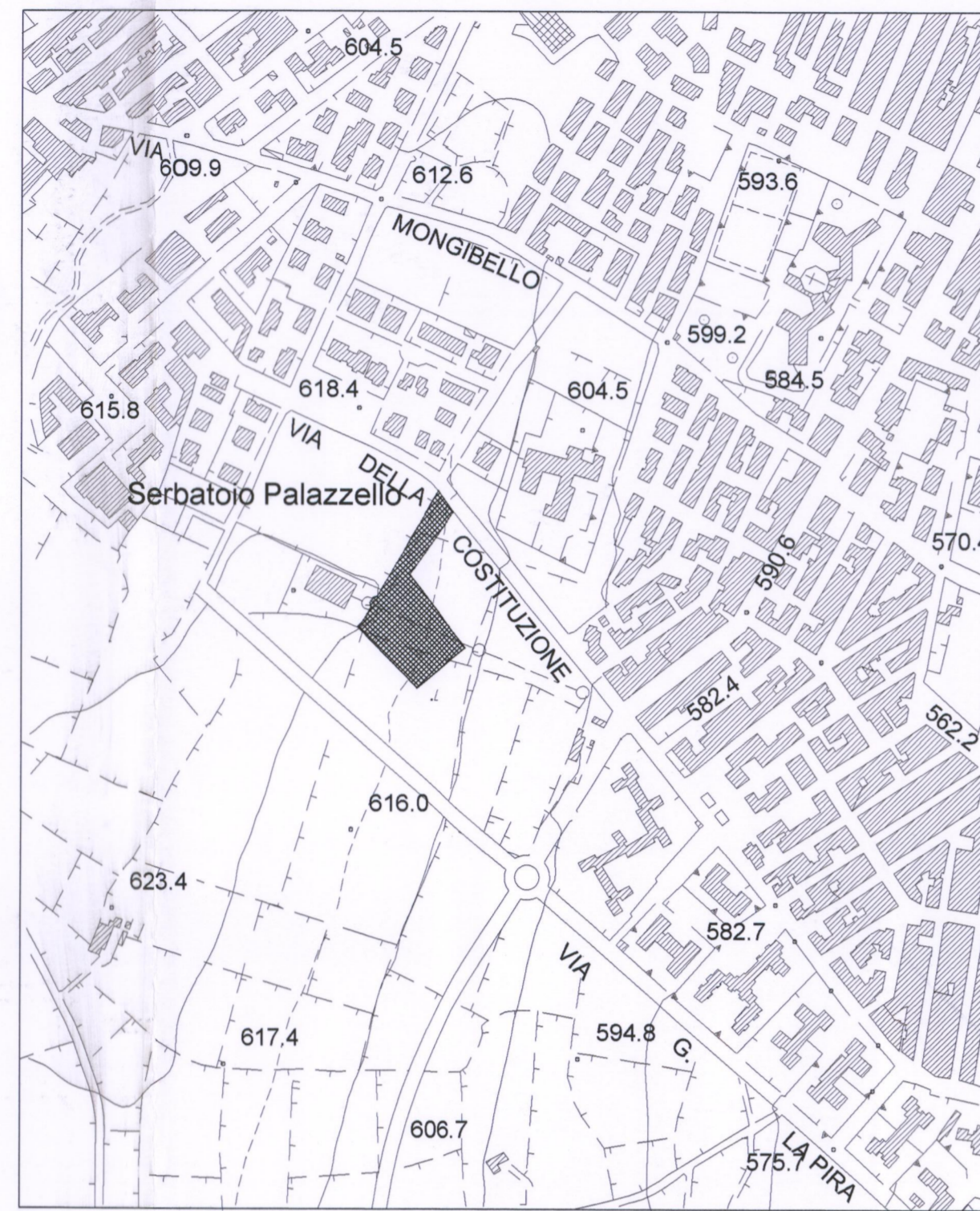
STRALCIO AEROFOTOGRAMMETRICO scala 1:5000